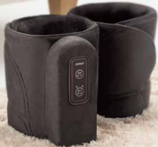
DB(ディープブラウン)